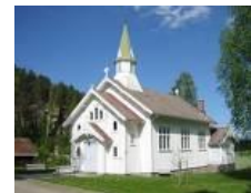
Holleby Kirke 3. juni

Hvis du vil konfirmeres i en annen kirke enn den du sogner til lar dette seg gjøre. Ta kontakt!