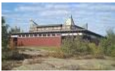
Greåker kirke 5., 6. og 13. mai

I 2018 er det konfirmasjon på disse dagene i kirkene våre: