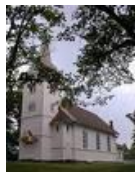
Soli kirke 27. mai